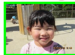
おうかさん 2 日生