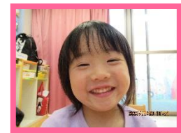
きあさん 29 日生