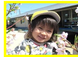
あきなちゃん 22 日生