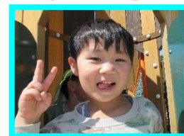
たけるくん 11 日生