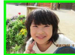
あかりさん 2 日生